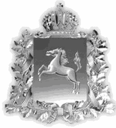
РИСУНОК НАГРУДНОГО ЗНАКА К ПОЧЕТНОЙ ГРАМОТЕ ЗАКОНОДАТЕЛЬНОЙ ДУМЫ ТОМСКОЙ ОБЛАСТИ